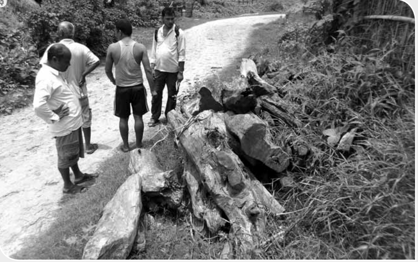
१ र २. सप्तरीमा जंगल मासेर काठ चोर्ने र हराउने सिलसिला ।