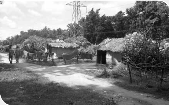
१, २ र ३. जंगल अतिक्रमण गरेर बसेको सुकुम्बासी र मुक्त कर्मैया बस्ती ।