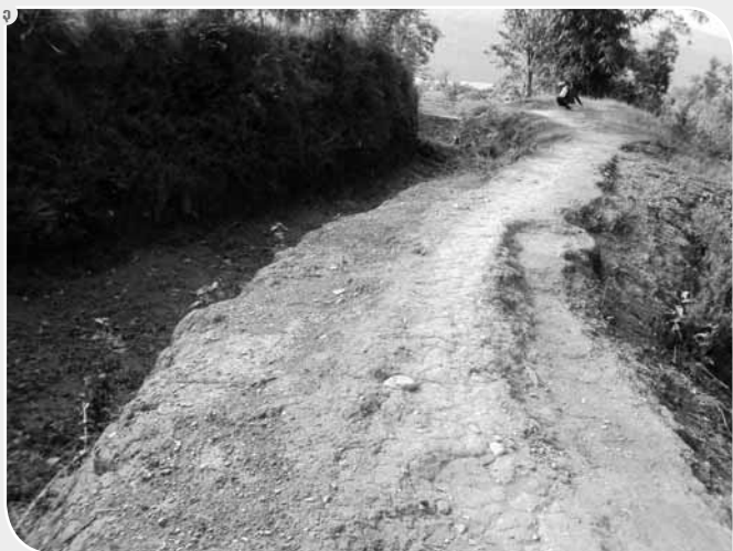
१ र २. कुन्दुरटार गाउँको नहरको खोब ।